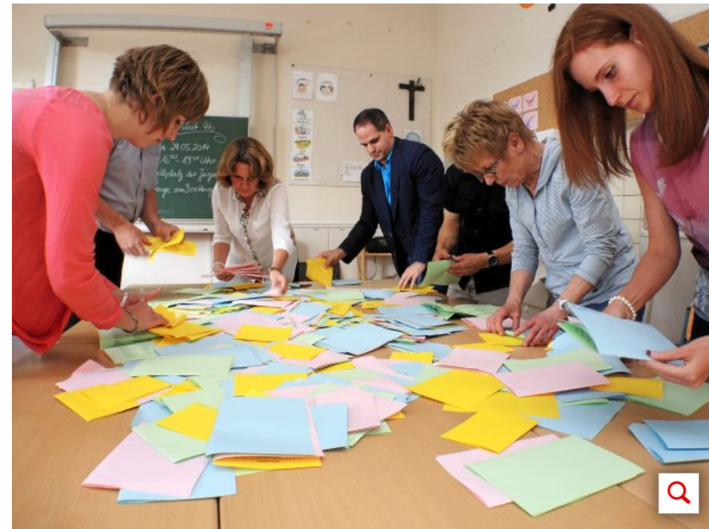
Vor sechs Jahren waren die Velberter zu letzten Mal zur Kommunalwahl aufgerufen.

immer mehr Parteien und Wählergruppen, die zur Kommunalwahl antreten. Es wäre daher ein guter Service, den Velberter Bürgerinnen und Bürgern zur nächsten Kommunalwahl eine digitale Orientierungshilfe anzubieten“, begründete die SPD damals ihren Antrag. Für die Einrichtung des Internetangebots wurden 9000 Euro im Haushalt zu Verfügung gestellt.