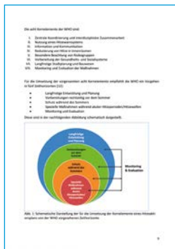
Abb. 1. Schematische Darstellung der für die Umsetzung der Konzeption eines Hitzeaktionsplans von der HAP ausgehenden Zielstruktur